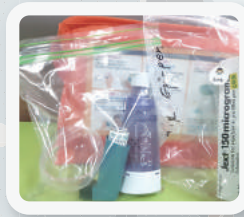
▪ 응급약품 비치