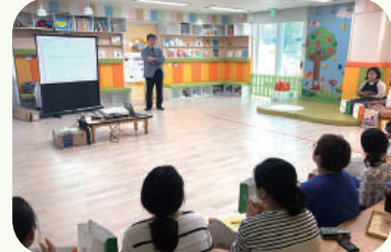
• 학부모 교육