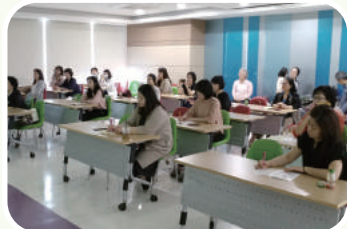
• 지역주민 교육