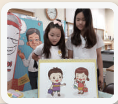
▪ 스토리텔링 연습