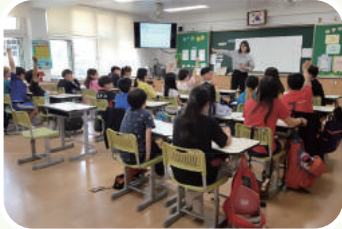
• 안심학교 방문 교육