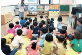
• 어린이집 방문 교육