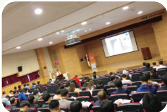
• 응급구조사 워크샵