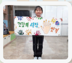
▪ 캠페인용 현수막 만들기

올 해 입학생 중 유당알레르기가 심한 학생이 있어 학교 내 응급처치 절차를 정비하고 천식 및 알레르기 응급약물을 비치하였습니다. 교직원 연수 및 학생 교육도 더불어 강화하여 실시했습니다. 알레르기와 관련된 질환들은 점차 증가할 것이라고 충분히 예상됩니다. 학교에서 이런 알레르기 질환 관련 응급상황에 대비할 수 있도록 학교 현장에 꼭 필요한 지속적이고 다양한 지원을 부탁드립니다. 보건소, 강원도 아토피·천식 교육정보센터 관계자분들과 함께 건강한 학교 만들기를 위해 노력하겠습니다. 감사합니다.