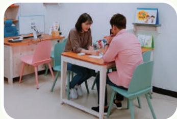
• 알레르기 질환 상담