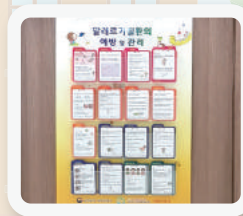
▪ 부설초 판넬