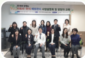
• 보건소 설명회