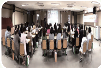
• 보건보육교사 교육